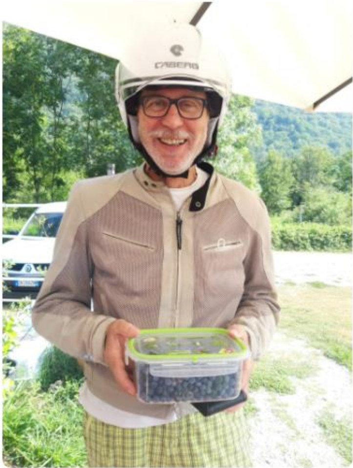
Contenitore preso e riempito